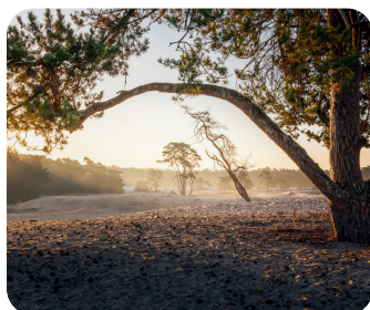
Den Ham, Hancate, Lemele, Ommen Fietsroute | 38 km